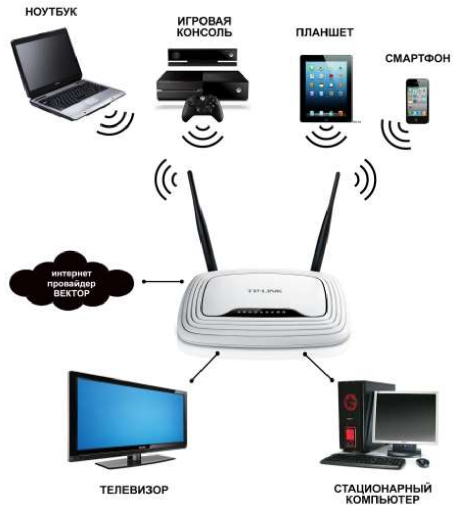
Схема типичной сети при использовании WiFi маршрутизатора TP-Link TL-WR841N

Подключить сетевой кабель в порт WAN, включить маршрутизатор. В течение 3 минут появится доступ в сеть интернет. Название WiFi сети и пароль доступа к ней находится на вкладыше в коробке с роутером.